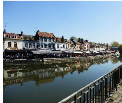
Troyes (oben links), Reims (oben rechts), Beauvais (unten links), Amiens (oberhalb), Johannes der Täufer (unten rechts)