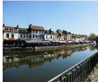
Troyes (oben links), Reims (oben rechts), Beauvais (unten links), Amiens (oberhalb), Johannes der Täufer (unten rechts)